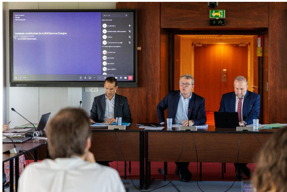
Assemblée Générale constitutive et Conseil d'administration de la SEM Essonne Énergies, le 10 juillet 2025