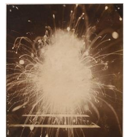
L’éclair du Volafil – Jules Courtier – entre 1880 et 1920

Armés de lampes de poches et autres sources lumineuses, venez tester la technique du light painting pour écrire des mots de lumière, souligner une silhouette ou créer votre double imaginaire !