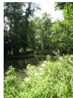
La mare, un riche écosystème en milieu boisé