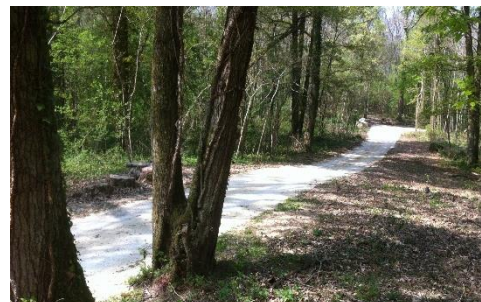
Chemin de la Coudraye