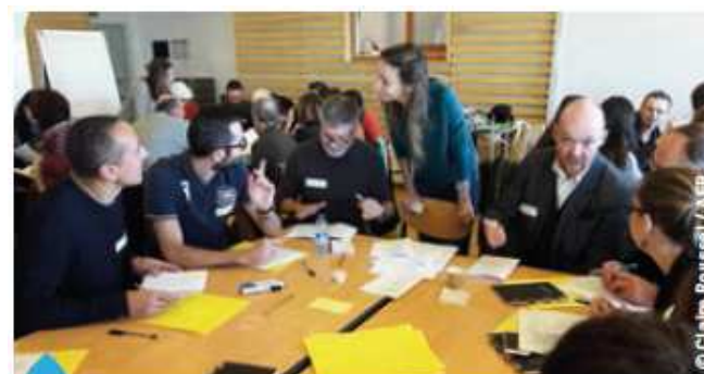
Un panel de citoyens a été interrogé par l'AFB sur ses attentes vis-à-vis des missions et de son implication dans la vie de l'Agence.