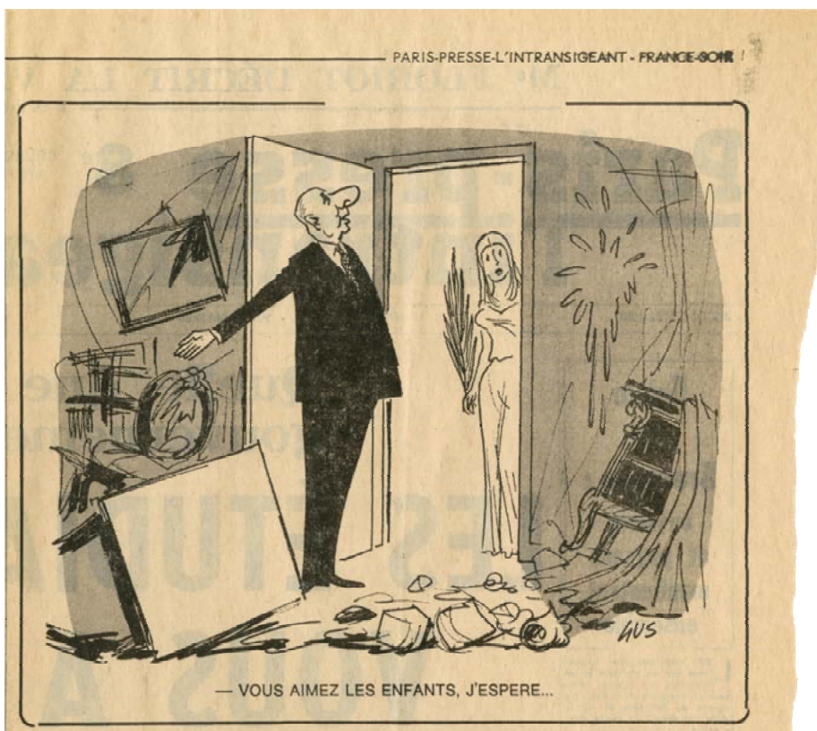
Vous aimez les enfants, j'espère... , dessin de Gus, Paris-presse l'Intransigeant, jeudi 9 mai 1968. AD91-124J50