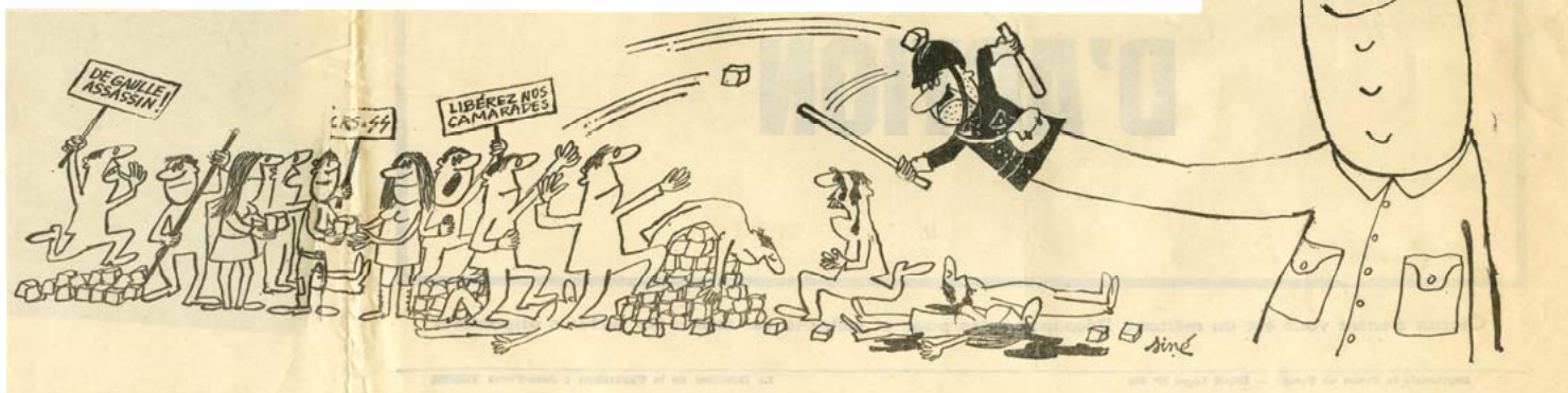
Dessin de Siné, Action N°2, 13 mai 1968, AD91-124J50