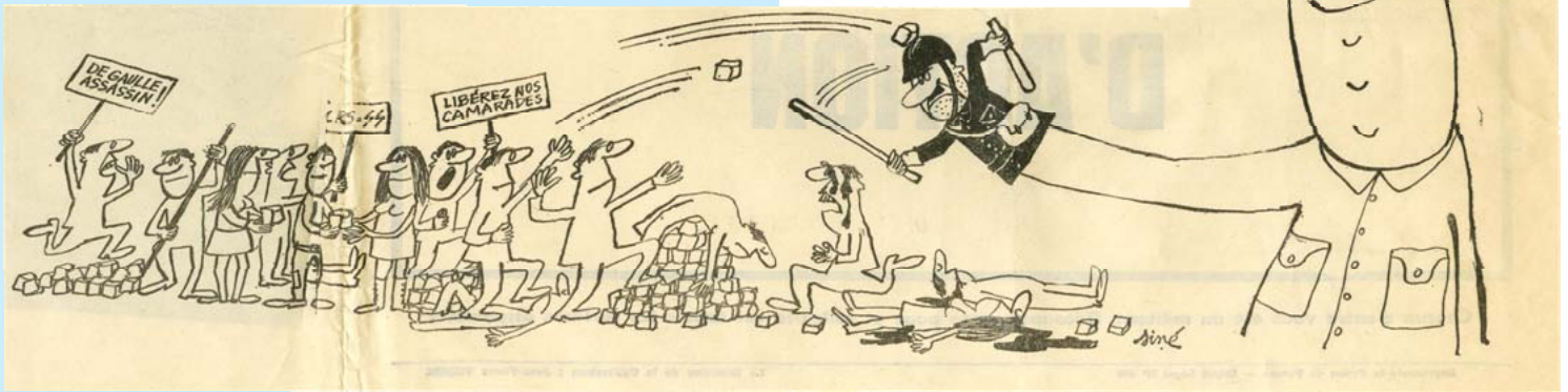
Dessin de Siné, Action N°2, 13 mai 1968, AD91-124J50