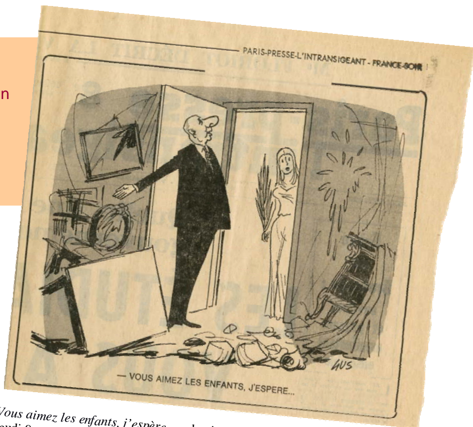
Vous aimez les enfants, j'espère... , dessin de Gus, Paris- presse l'intransigeant , jeudi 9 mai 1968. AD91-124J50

Ces deux documents donnent -ils la même vision de Mai 1968 ? Pourquoi ?