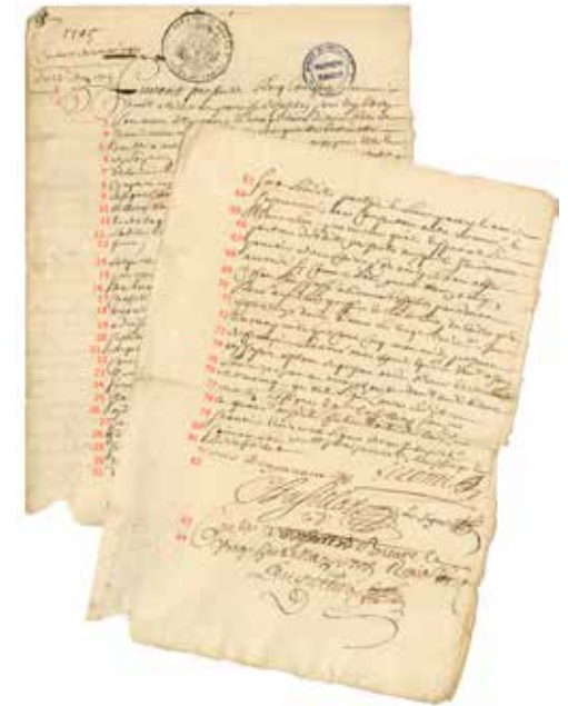
Contrat de mariage, 1705. Arch. départementales de l'Essonne E/4344.