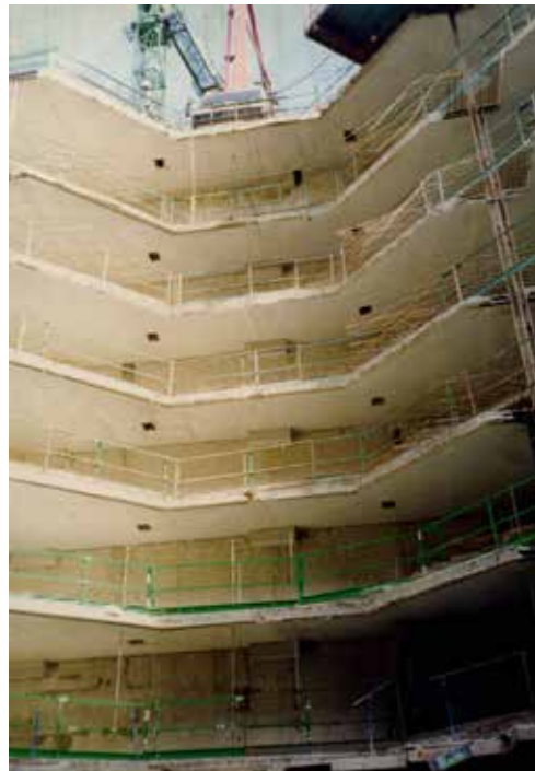
Chantier des Archives départementales à Chamarande

Découvrez les missions des Archives départementales, la richesse et l'importance de leurs collections (18 km d'archives du XII e au XXI e siècle) en suivant le circuit d'un document d'archives : de son arrivée par la salle de versement à sa communication en salle de lecture sans oublier sa conservation dans des magasins.