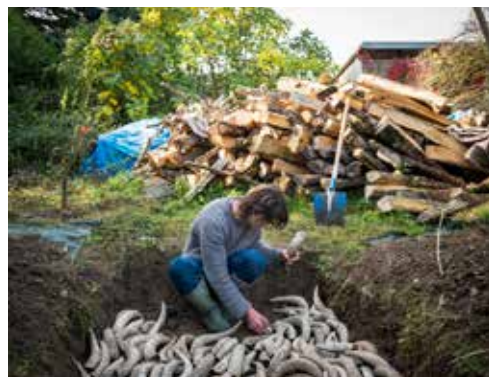
Fabrication d'engrais naturel, Thésée Loire et Cher.