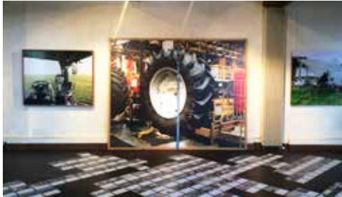
Hall des Archives départementales de l'Essonne

Samedi et dimanche, visite libre de 14h à 18h