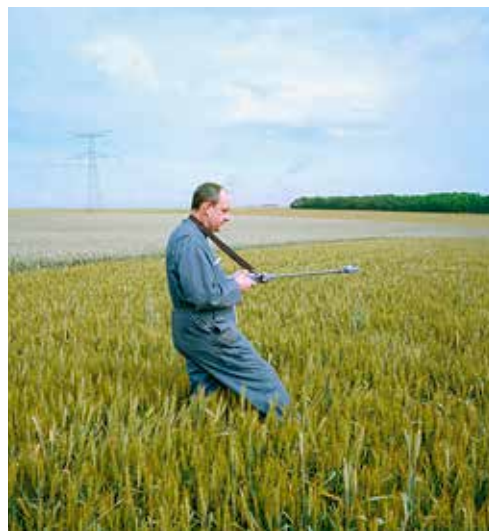
Mesure de la biomasse, Champmotteux, Essonne.