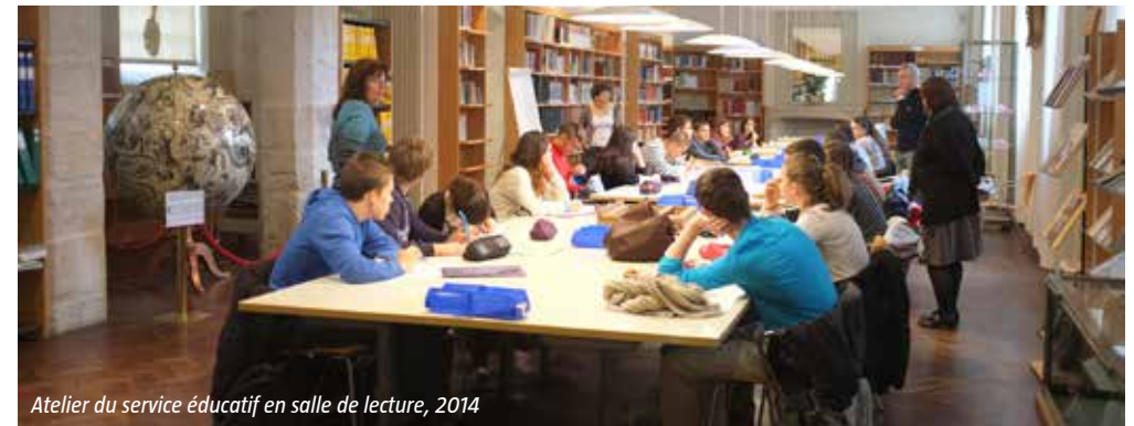
Atelier du service éducatif en salle de lecture, 2014

RENSEIGNEMENTS AU 01 69 27 14 14 Programmation sous réserve de modifications