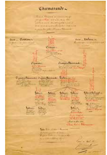
Généalogie de la famille de Talaru Chalmazel. Arch. départementales de l'Essonne 39J/3.

Être né quelque part pour ne pas perdre la mémoire... Que vous soyez essonnien ou pas, vous découvrirez les documents et méthodes pour bien commencer ses recherches : quels documents et sources consulter, les outils d'aide pour construire son arbre, et des conseils. Chaque participant peut apporter des documents.