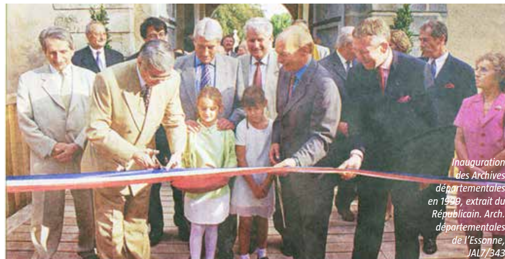
Inauguration des Archives départementales en 1999, extrait du Républicain.