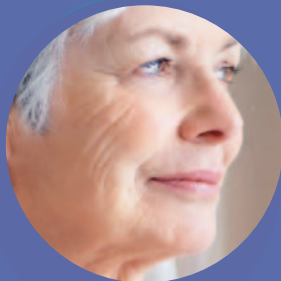
SCHÉMA DÉPARTEMENTAL EN FAVEUR DES PERSONNES ÂGÉES 2011 ► 2016