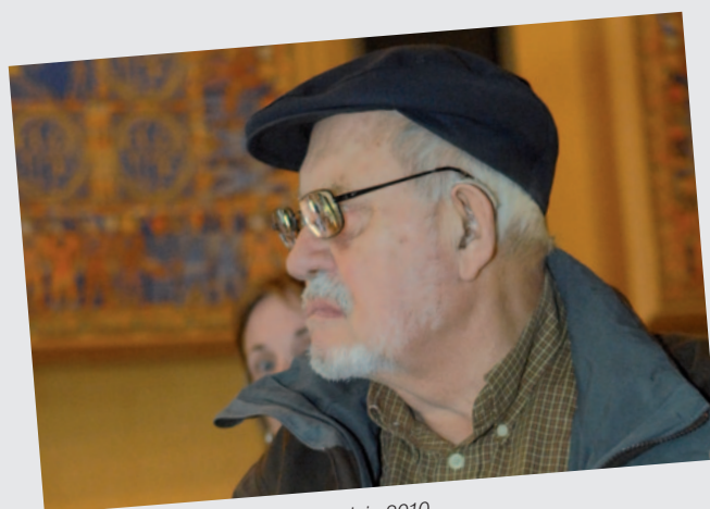
Les photographies de ce schéma sont issues des Rencontres du « Bien vieillir en Essonne », réalisées du 19 mai au 3 juin 2010.