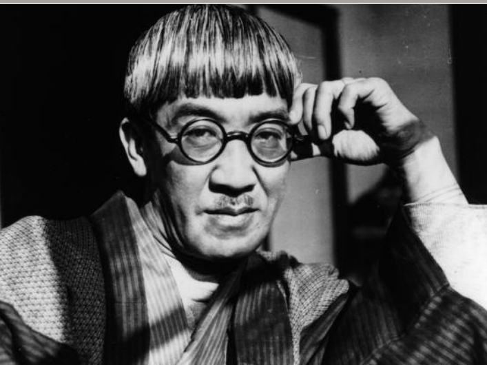
Foujita au Japon en 1936