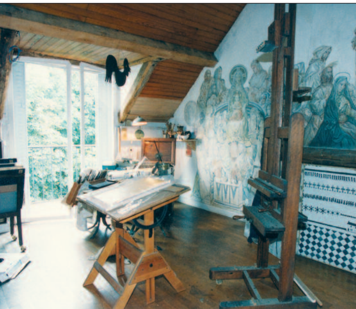
Vue de l'atelier de l'artiste