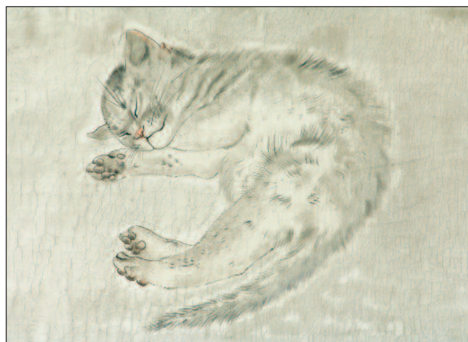
Détail de la Grande composition, huile sur toile, 1928