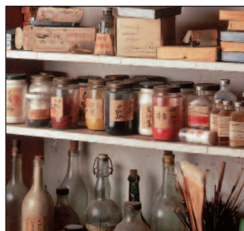
Pigments et matériaux de l'artiste