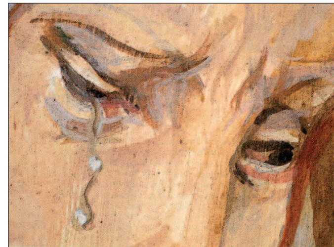
Vierge, détail de la fresque de l'atelier, 1966

En novembre 1960, Foujita achète la maison de Villiers-le-Bâcle située en bordure du plateau de Saclay, aux confins des départements de l'Essonne et des Yvelines. Cette petite maison rurale surplombant la Vallée de la Mérantaise est restée en l'état depuis la mort de l'artiste en 1968.