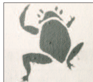
Grenouille, pochoir à l'encre, paravent, 1955