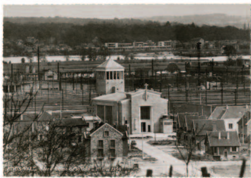
Athis, église Notre Dame de la Voie, carte postale, 1954.

L'architecture des églises en Essonne au XX e siècle