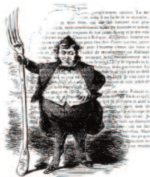
Montage © Théâtre du Menteur