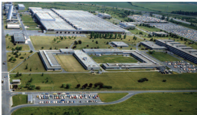
Vue aérienne de la SNECMA, Évry, [1960]- 43F408/3