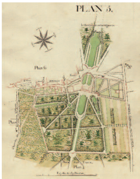
Château et parc de Fleury, XVIII e siècle. – 59J/23.

L'ascension sociale de la famille des Joly de Fleury a permis la constitution d'un patrimoine et la construction progressive de la seigneurie de Fleury-Mérogis, Grigny, Bondoufle avec mise en valeur de ces propriétés.