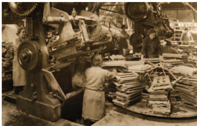
Tuileries Gilardoni, Corbeil, [début XX e siècle]. – 24J/7

Privilégiant quatre thématiques : identités territoriales, identités professionnelles, communautés et diversité, identités de classe, l'exposition explore la recomposition des identités locales lors de restructurations économiques.