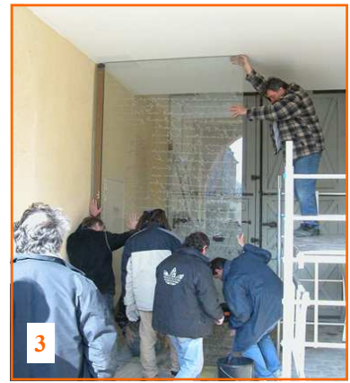
1 porte 2 et 3 montage de la porte 4, 5, 6, 7 plan, écritures et poignées (détails)