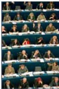
Parlement européen Affiche représentant des députés européens dans le parlement