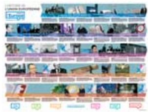
L'histoire de l'Union européenne Frise historique de l'UE de 1945 à 2009