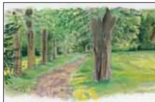
L'allée de tilleuls