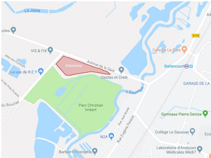
GT1 – CARTE DE LA DEPOSANTE DU BOUCHET

Déchets radioactifs Faiblement Actifs à Vie Longue (FAVL), notamment de l'uranium.