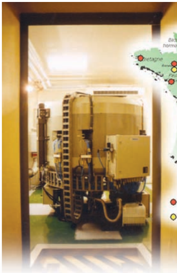
nouveau cyclotron du SHFJ