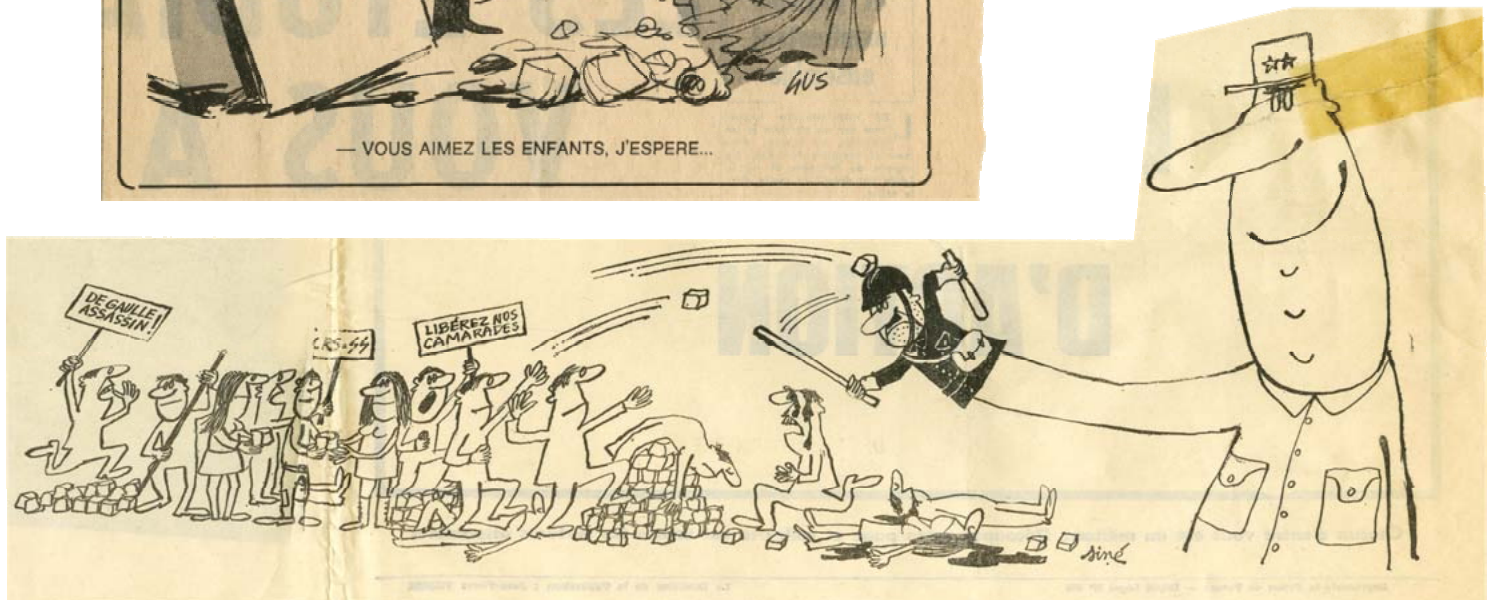
Dessin de Siné, Action N°2, 13 mai 1968, AD91-124J50

Consigne : Après avoir présenté et contextualisé les deux documents, vous en ferez une description puis une analyse critique montrant l'image de la France de mai 1968 dans la presse.