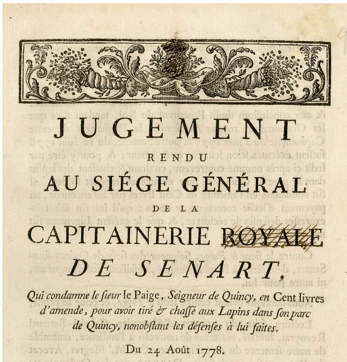
Jugement de condamnation de la capitainerie, 1778. DAPM91 - non coté