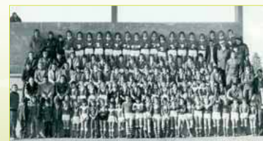
Début des échanges entre le CA Castelsarrasin et Chilly (1977-1978).