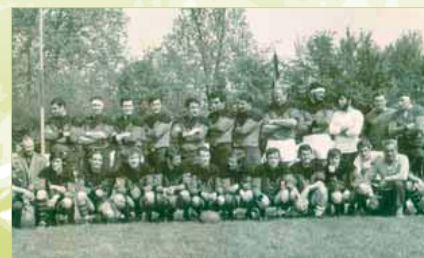
Equipe de Yerros en 1969. Cf. ROY