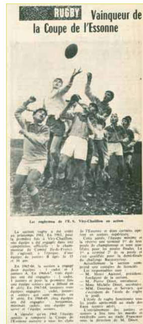
Le Républicain, juillet 1969