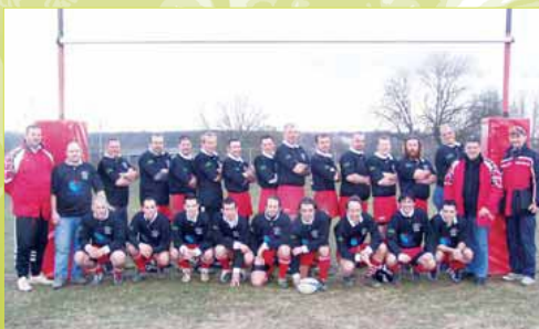
Équipe de Sainte-Geneviève-des-Bois (ex Cl. Sainte-Geneviève Sports Rugby)

Date de création : 1966 Anciens noms : SGER-Sainte-Geneviève Évry Rugby (1999-2002) Terrains : stade Romain Rolland puis parc Pierre à Sainte-Geneviève-des-Bois Couleurs : rouge et blanc Féminines : depuis 1997 [Fédérale 3 en 2007] Titres : 1987-1988 : champion d'Ile-de-France réserve 1 re série 2000-2001 : champion d'Ile-de-France 1 re série 2001-2002 : champion d'Ile-de-France minime B1 2004-2005 : vice-champion d'Ile-de-France 2 e série Faits marquants : 1968-1972 : montée en 3 e série, puis en 2 e série 1980-1983 : montée en 1 re série et en division d'honneur 1990-1991 : regroupement avec le club de Fleury-Mérogis 1992-1995 : montée en 1 re série puis en division d'honneur 1999-2002 : formation du Sainte-Geneviève Évry Rugby (SGER) par la fusion entre le Sainte-Geneviève Sports (SGS) et l'AS Évry Rugby 2004-2005 : montée en 1 re série 2006-2007 : récréation de l'équipe féminine (3 e division fédérale)