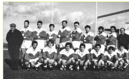
Equipe de Savigny-sur-Orge 1969 - Cl. Rugby Club de Savigny-sur-Orge

Date de création : 1949 Anciens noms : Sporting Club de Savigny-sur-Orge de 1949 à 1981 Terrain : stade Jean Moulin à Savigny-sur-Orge Couleurs : blanc et bleu Titres : 1969, 1991, 2001 : champion d'Ile-de-France honneur 1987, 1997 : champion d'Ile-de-France série 2004 : challenge régional Danet pour les juniors Faits marquants : 1969 : montée en comité d'honneur régional 1976 : 1 er club essonnien à monter en 3 e division 1984 : retour en 3 e division 2003 et 2004 : le stade Jean Moulin de Savigny-sur-Orge a accueilli des matchs du championnat du monde junior Espagne-Portugal et du tournoi des VI Nations