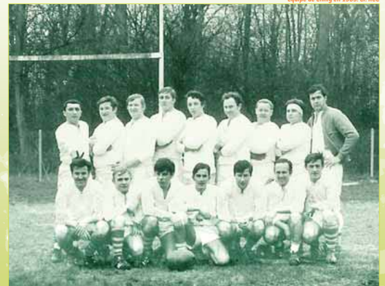
Equipe de Chilly en 1969.