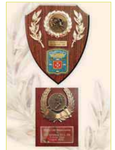
Trophées de Ballancourt.