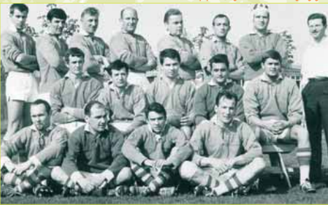
Equipe d'Orsay en 1966.