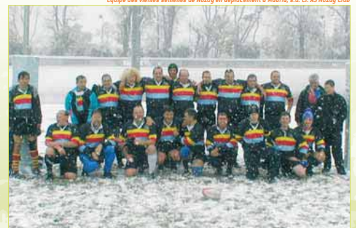
Equipe des vieilles semailles de Nozay en déplacement à Madrid, s.d.

2004-2005 : entente avec le rugby club ballancourtois et l'école de rugby de Janville- Lardy pour jouer en équipe complète