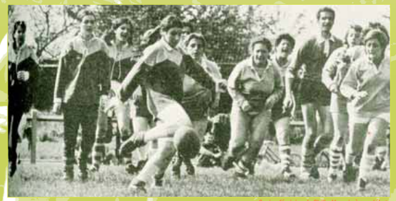
Equipe féminine de Chilly-Mazarin à ses débuts Le Républicain , 11 mai 1972