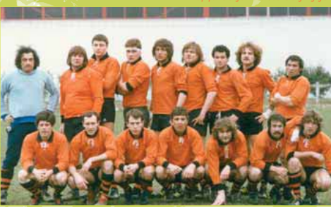
Equipe d'Orsay en 1989.