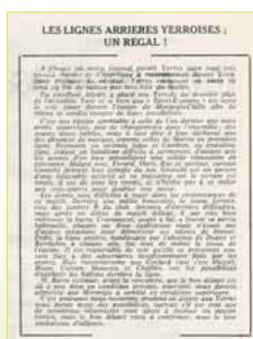
Sport Essonne, mai 1971