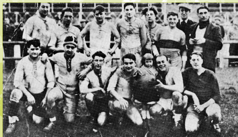
L'équipe de Corbeil en 1932. Cf. ASCR-RCM

À Corbeil , de nouveaux clubs apparaissent dans les années 1930 et rivalisent avec le Club Athlétique de Corbeil . Le club sportif ouvrier de Corbeil , créé en 1922 avant de prendre en 1935, le nom d' Entente Sportive de Corbeil-Essonne , et le Rugby Club corbeillois , créé en 1932, partagent ainsi la rubrique sportive du journal l'Abeille de Seine-et-Oise avec le CAC.