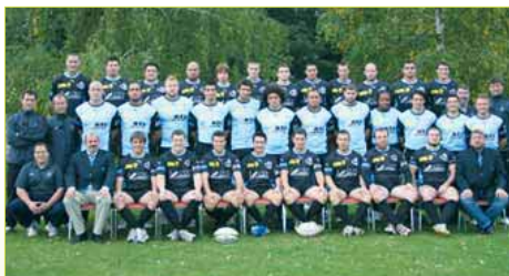
Equipe senior de Massy 2006-2007.