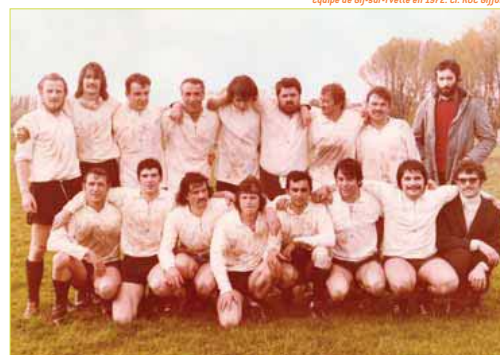
Equipe de Gif-sur-Yvette en 1972.