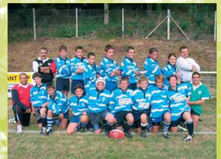
Equipe de Saintry, s.d.