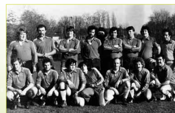
Equipe de Gif-sur-Yvette en 1982-1983.