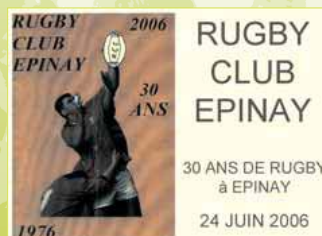
Anniversaire du club d'Epinay-sur-Orge en 2006.