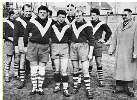
Equipe de Corbeil en 1955.